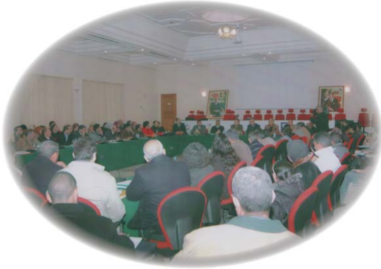
Première consultation de ville d'El Hajeb du 20 et 21 février 2008

Au terme du débat entamé en séance plénière lors de la première consultation de ville d'El Hajeb du 20 et 21 février 2008, les participants se sont répartis en deux groupes de travail, selon les 2 thèmes retenus. L'un dédié à l'amélioration du cadre de vie , le second au tourisme , « locomotive du développement ». Deux experts recrutés par le projet Agenda 21 ont assuré l'animation d'une série d'ateliers selon le calendrier suivant : le 20 et 21 février, le 13 et 18 mars et le 22 et 30 mai 2008.